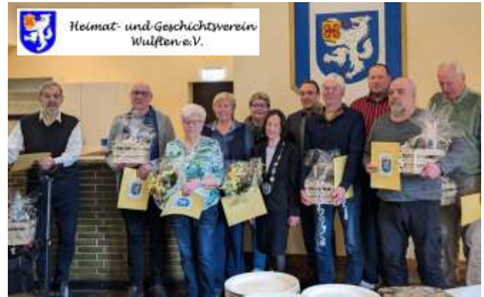
Gruppenfoto der Geehrten:

Nach den Ehrungen wurde ein Essen gereicht und anregende Gespräche geführt. (G. Lüer)