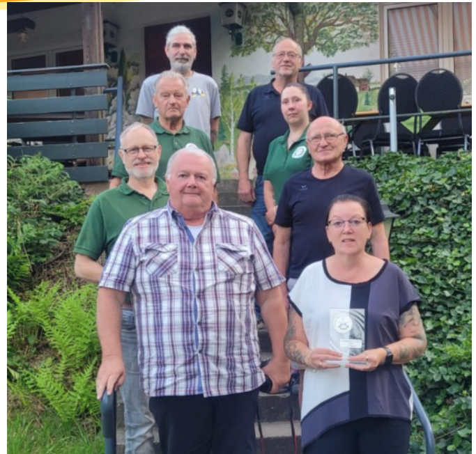
Die Siegerehrung fand am 21.06.2025 im Schützenhaus statt, es gab am Abend ein kalt-warmes Büffet. Die Anwesenden genossen den lauen Sommerabend bei kühlen Getränken und mancher angeregten Unterhaltung.