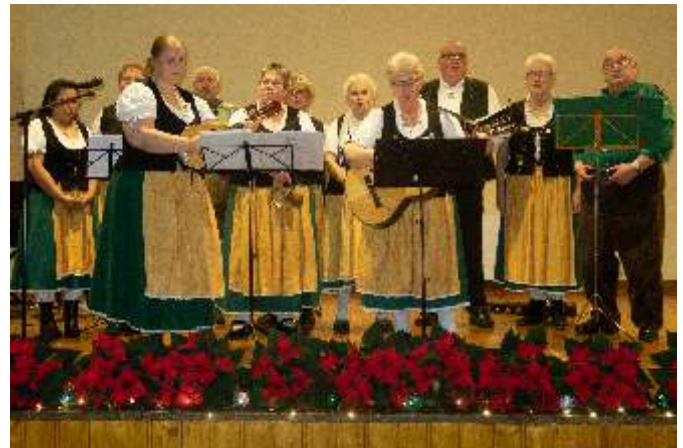
Die Harzer Brauchtumsgruppe „Die Lerbachtaler“