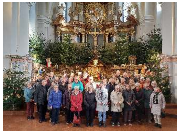
Es war ein beeindruckender Besuch, der die Botschaft von Weihnachten sichtbar vor Augen führt. Mit dem Gesang des Liedes „O du fröhliche“ endete die Führung. Ein gemeinsames Foto vor der Krippe hielt die Erinnerung fest. Anschließend ging es ins Hofcafé, wo man bei Kaffee und Kuchen den Tag ausklingen ließ.

Neben den Holzfiguren gibt es noch ausgestopfte natürliche Tiere wie Hahn, Eichhörnchen, Fuchs und Greifvögel. Niemand soll ausgeschlossen sein. Mehr als 20 Tannenbäume rahmen die Krippe ein.