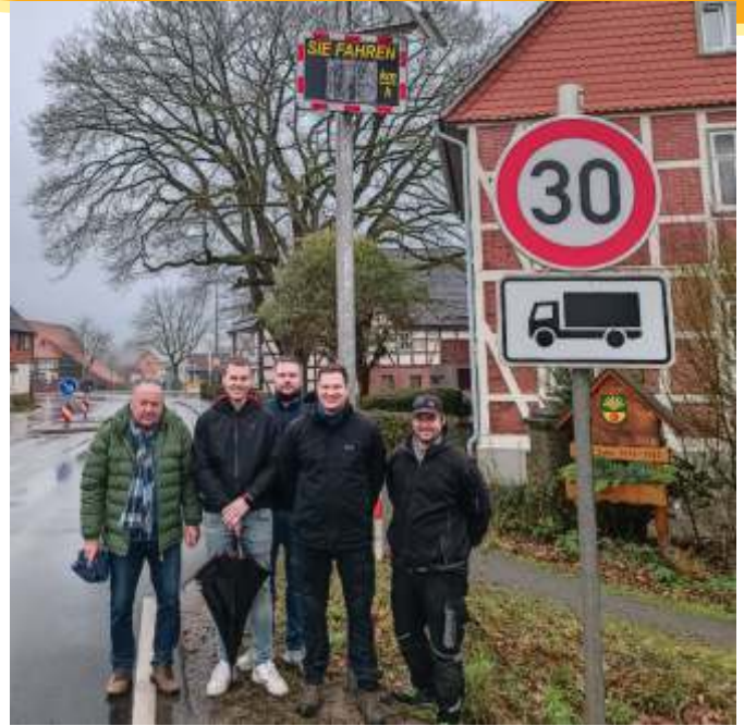
Mit der kleinen Maßnahme der Anschaffung der Tafel erhofft man sich zumindest in Puncto Geschwindigkeit eine Besserung.

Erste Anlieger bescheinigten der Maßnahme bereits positive Auswirkungen. Mit mehr als 6.500 Fahrzeugen pro Tag ist der Streckenabschnitt der B241, der durch Dorste führt, stark frequentiert. Dies führt zu einer nicht unerheblichen Belastung für die Anlieger. Insgesamt, so die Meinung einiger Einwohnerinnen und Einwohner, sei ein immer rücksichtsloseres Verhalten der Verkehrsteilnehmer zu beobachten. So rauschen viele PKW-Fahrer beispielsweise einfach über den Fußgängerüberweg und geben Fußgängerinnen und Fußgängern kaum die Chance, diesen zu überqueren.