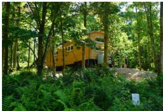
Der moderne Bauwagen bietet Gemütlichkeit und Schutz bei unbeständigem Wetter.

Der neue Waldorf Waldkindergarten bietet den Kindern also eine einzigartige Möglichkeit, die Natur hautnah zu erleben und ihre Umgebung auf spielerische Weise zu entdecken. Das gemeinsame Erleben im Wald trägt außerdem zur sozialen Entwicklung bei und schafft eine enge Verbindung zur Umwelt. Im Übrigen hat der Bauwagen von den Kindern schon einen Namen erhalten, er wird liebevoll als "Waldvilla" bezeichnet.