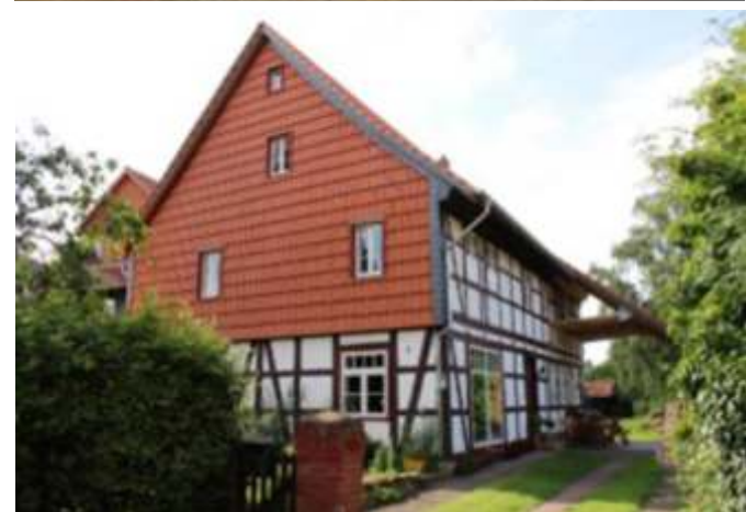
Drei von rund 70 sanierten ortsbildprägenden Gebäuden in privater Hand.