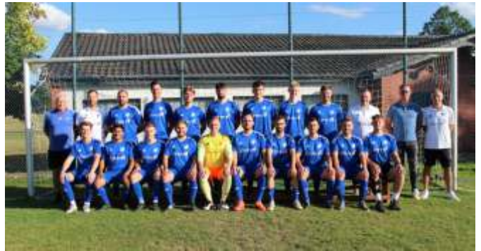
Unsere Erste Herrenmannschaft