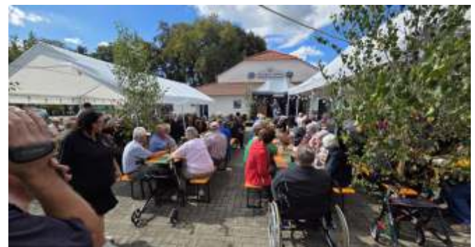
Blick auf den Festplatz