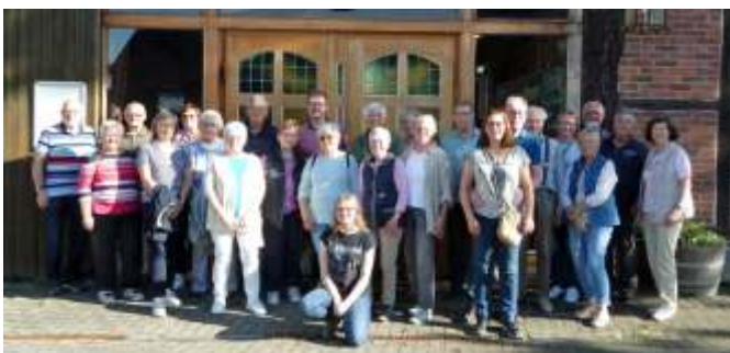
Teilnehmer des HGV

Text: HGV / Rolf Haarmann, Fotos: HGV / Gerhard Lür