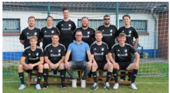
Unsere Zweite Herrenmannschaft