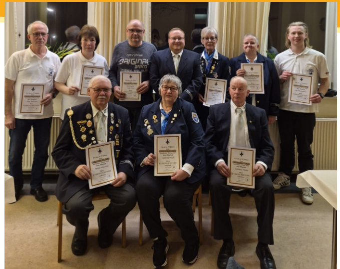
Auf dem Bild sind die anwesenden geehrten Mitglieder.

Es wurden zahlreiche Ehrungen für 10- bis sogar 50-jährige Mitgliedschaft verliehen. Bei den Wahlen war man sich schnell einig, da die Posten fast alle durch Wiederwahl bestätigt wurden. Die größte Veränderung ist der Wechsel zum Kreisverband Duderstadt, da sich der Kreisverband Osterode leider mangels Teilnehmer aufgelöst hat.