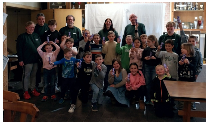
Gruppenfoto der Teilnehmer

Als Highlight mit hohem Spaßfaktor erwies sich das Blasrohrschießen. Nach genauer Instruktion zum Halten des Blasrohres, zum ordentlichen Luftholen und kräftigen Hineinblasen flogen die kleinen Pfeile Richtung Zielscheibe, die natürlich auch oftmals unter Beifall der zuschauenden Kinder getroffen wurde. Selbstverständlich wird diese Schießsportart unter Beachtung der Hygienevorschriften durchgeführt. Auch alle weiteren Stationen, wie beispielsweise das Zielen mit der Nerf-