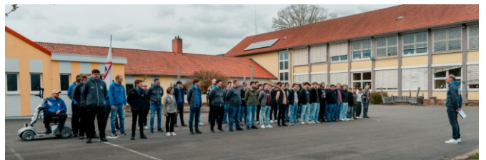
Der amtierende Schützenvorstand freut sich, viele Gäste aus nah und fern in Wulften begrüßen zu dürfen und mit allen ein unvergessliches Fest zu erleben.

Der Vorverkauf für die Dauerkarten und das Schützenfrühstück startet am 04. Mai bei der Fleischerei Bähr.